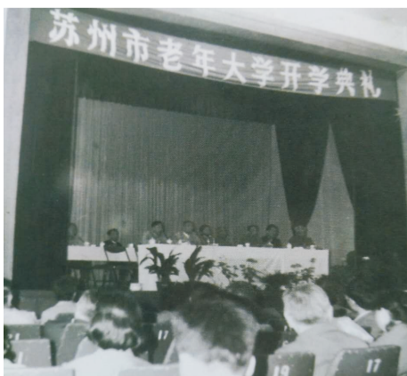
首届开学典礼 1985年5月2日上午

回顾当年草创时期,一路艰辛,一路充满信心。我是办校的亲历者、见证者,因我住在万寿宫南面的一条小巷内,当时的老年大学校务委员、市书法研究会会长朱第对我说,因为你住的最近,又有教夜校书法的经验,确定你同程可达、程质清两位前辈作为师资。因而在1984年曾两次去过当时的市老干部局(五卅路上章太炎故居)参加筹备建校的座谈会。依稀记得当时的局长说:“校址初步确定在民治路的万寿宫内,那个地方现在是市青年宫所在地,处在市中心地带,我们退下来的老干部在岗位上为党为国家多多少少作出过贡献,年岁大了,找个地方继续学习,圆个大学梦。一张白纸从头开始,得有个安静的环境,经过几次察访,反复论证,认为在靠近大公园的万寿宫最为适宜,地段适中,交通又便利。可是曾有几家新建单位都相中这块风水宝地,我们向市委、市政府申请,据理力争,经上级周密平衡才同意我们的要求,接下来要讨论商量的事情很多,如规