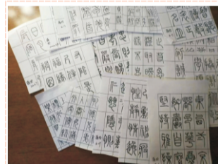
学员网上作业示例