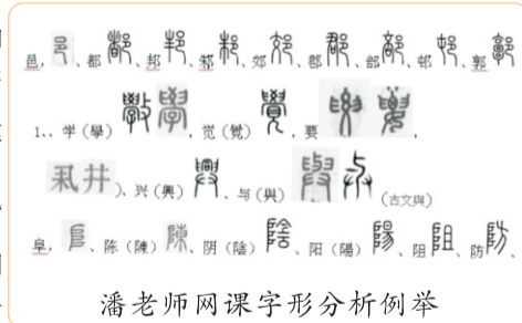
潘老师网课字形分析例举