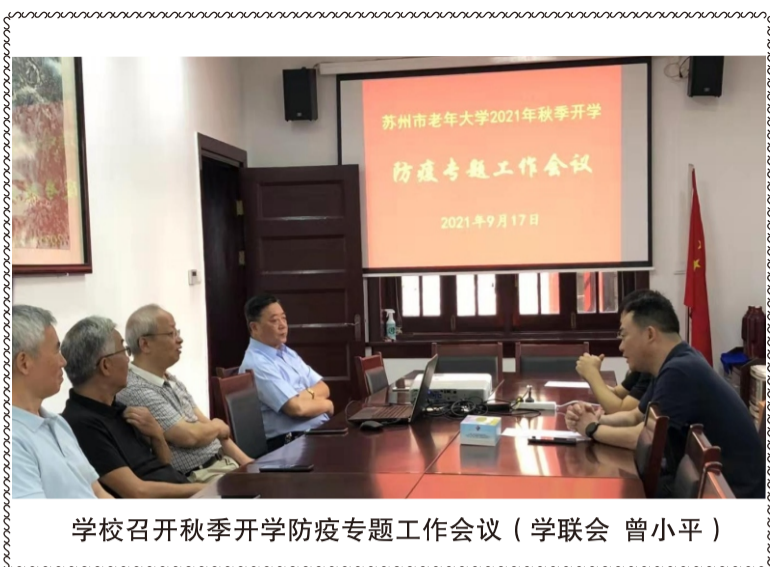
学校召开秋季开学防疫专题工作会议(学联会 曾小平)