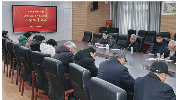
2月24日, 苏州市老年大学举行2024—2025学年第二学期开学工作会议, 部署了本学期的各项工作。(综合办)

学校网址: http://szlndx.suzhou.edu.cn 2025年第1期 总167期 准印证号: S(2025)05000024 (内部资料 免费交流) 2025年3月03日