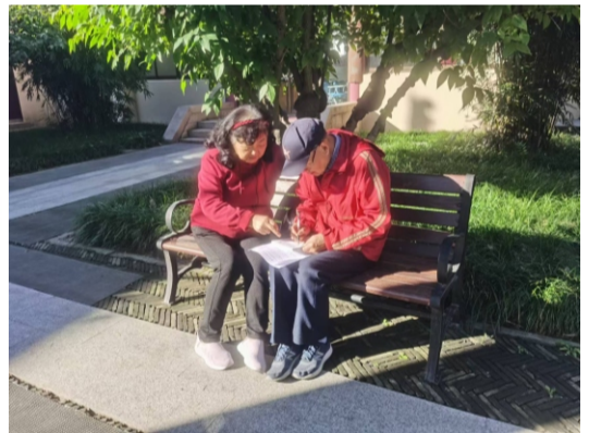
互帮互学

条件的反射作用~弯起了嘴角。果不其然，在今天的苏州市老年大学寻觅非物质文化遗产课堂里笑声不断，有学员竟笑得前仰后合（有拍下的照片和视频为证）。