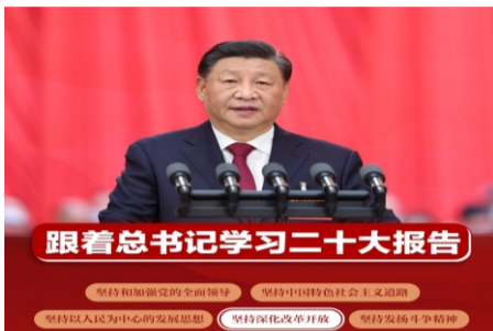
跟着总书记学习二十大报告

坚持和加强党的全面领导 坚持中国特色社会主义道路 坚持以人民为中心的发展思想 坚持深化改革开放 坚持发扬斗争精神